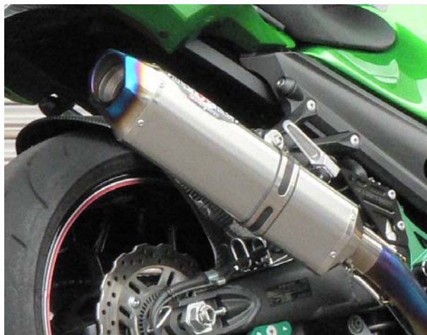
画像は ZX-14R の装着イメージです。