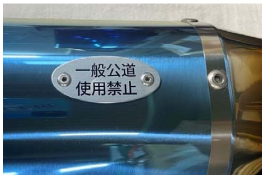
サイレンサー裏側の 「一般公道使用禁止」のプレートが目印