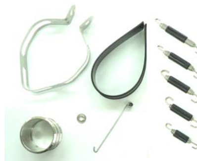
各オプションパーツを設定