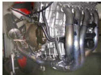
サイレンサー外径/内径/構造 120φ / 54.0φ / 完全ストレート

異径パイプやダブルバイパス等の採用により、従来品と同等のパワーを確保しつつスタンダードからチューンアップエンジンまで幅広いセッティングレンジとキャパシティを実現いたしました。セッティングとチューンアップ内容如何によっては、トップコンストラクターと同等のパワーフィールを手に入れる事も夢ではありません。