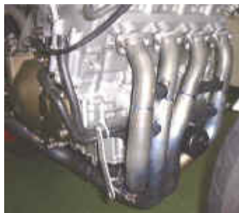
フロントパイプ径 38.1φ > 42.7φ 異径複合