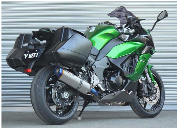
画像は Evolution Type II クリアチタン仕様です。