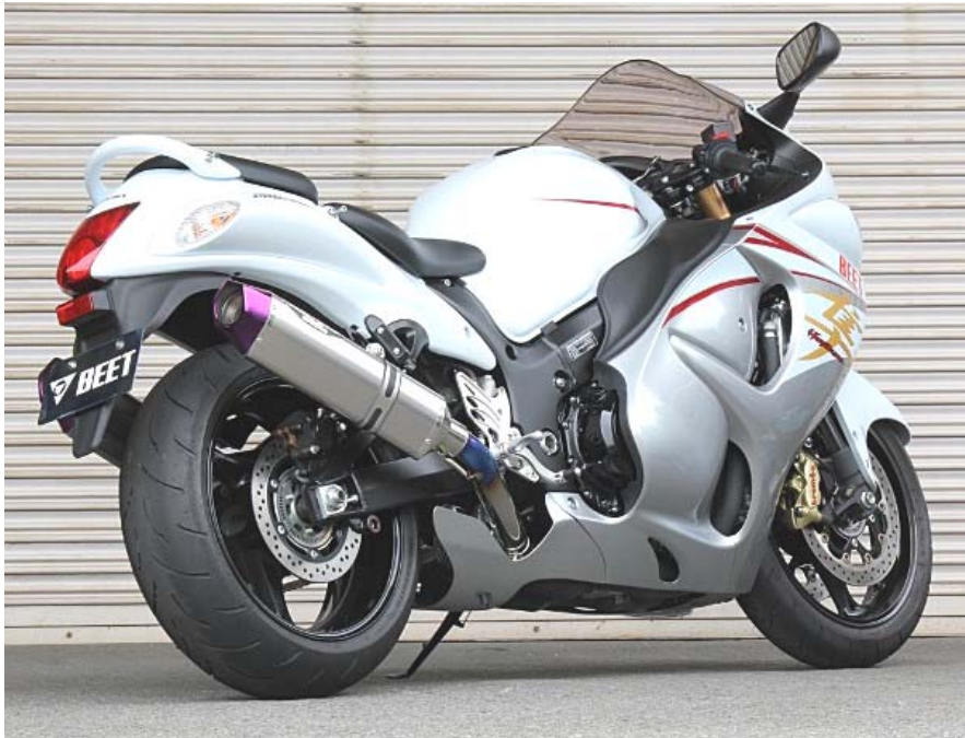
上記画像は、クリア・ピンクパープルサイレンサー仕様です。

NASSERT Evolution Type II に待望の SUZUKI 14 年以降の国内モデル GSX1300R 準用が満を持して登場！ フラッグシップモデルに相應しい 2 本出しの迫力ある外観と、スリップオンマフラーとする事でマフラー交換の煩わしさを軽減した上で、相反する動力性能と環境性能を高次元でバランスさせた逸品です。