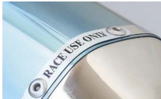
「RACE USE ONLY」のプレートが目印