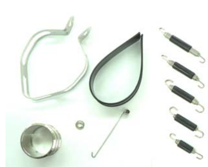
各オプションパーツを設定