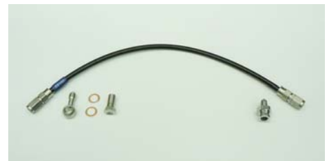
(株)プロト社製 SWAGE-LINE を付属

品番 0111-KB8-20 (シルバー) 固定式 税込価格 ¥88,000-(税別 ¥80,000-) JANコード 4582346459552