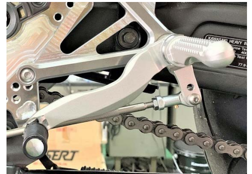
逆シフト仕様のペダル形状です