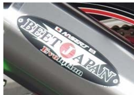
エンブレムは順次変更となります。