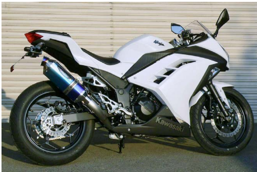
画像は Ninja250 装着状態です。

カワサキワークス Team Green (ZX-10R) も採用中! と同形状のサイレンサー! 新世代 Evolution マフラー 遂に始動!! 最高性能! 最高精度! リアル官能フィーリングを体感して下さい!!