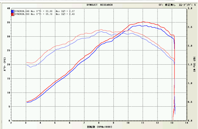
265ccKIT+NASSERT-R (JM) +Power Commander

コード No. 0601-K95-00 税込価格¥36,750 (税別¥35,000)