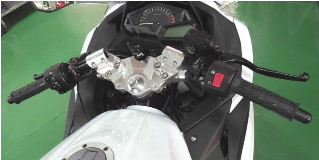
※ 弊社トップブリッジとの装着例です