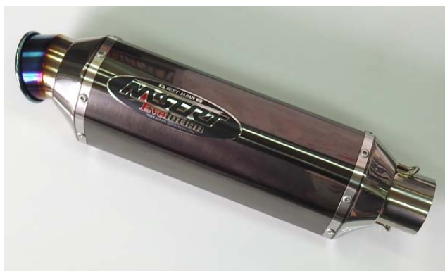
新作 ステンブラック仕様