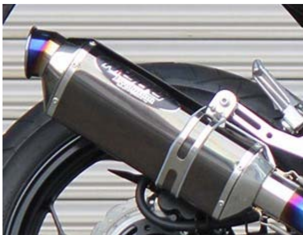
新作 ステンブラック仕様