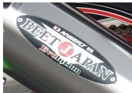
エンブレムは順次変更となります。