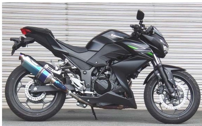
Ninja250とZ250が、共用となっております。