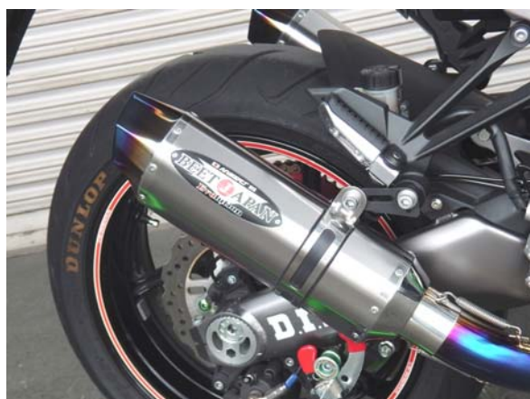
New エンブレムはリベット止めです。

※注意! エキパイ4番と右カウル下側が接触しますので、カウルを一部切除する加工が必要です。