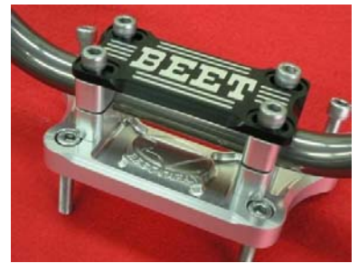
ブレース(ブラック)付き仕様

ブレース無しKIT 品番 0605-KB1-00 税別価格 ¥36,000- JANコード 4582346458814