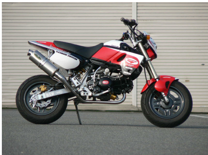
NASSERT-R Limited Ver. 2(110cc用)

今般弊社では、KAWASAKI KSR110 に、以前50セット限定発売にしてアツという間に完売、その後も非常に多くのお問合せを戴いた、前回(Ver. 1)のNASSERT-R後継バージョン2及びバージョン3を限定発売致します。