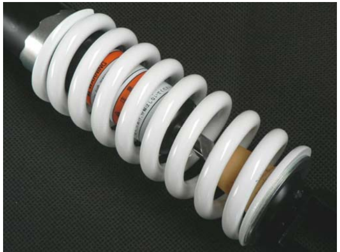
組み込み画像は Ninja250 用です。

`18~Ninja250/400 ノーマリアサスペンション用のハードスプリング KIT です。