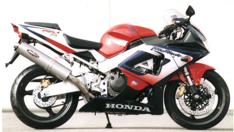
NASSERT-R スリップオン TI/TI CBR929RR